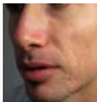
Efter 3 behandlingar