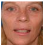
Efter 1 behandling