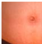
Efter 1 behandling